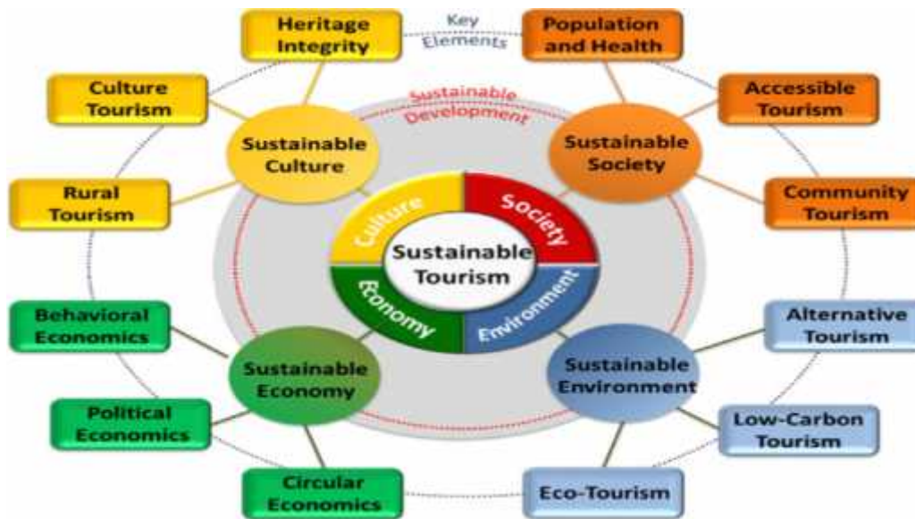
Gambar 2. Four conceptual aspects required for achieving sustainable tourism.

Kegiatan pariwisata berkelanjutan terutama mencakup lingkungan, ekonomi, sosial dan aspek budaya pembangunan. Gambar. 2 ini mengilustrasikan konsep dari empat aspek keberlanjutan untuk pariwisata. Karena sumber daya alam mungkin dieksploitasi secara intensif dalam bisnis pariwisata, kegiatan pariwisata kadang akan menimbulkan dampak besar pada lingkungan, ekosistem, ekonomi, masyarakat dan budaya. Potensi dampak lingkungan secara luas mulai dari polusi laut global hingga gangguan lokal di daerah yang terancam punah spesies tumbuhan dan hewan di kawasan lindung (Buckley, 201; Shu-Yuan Pan, et, al, 2018).